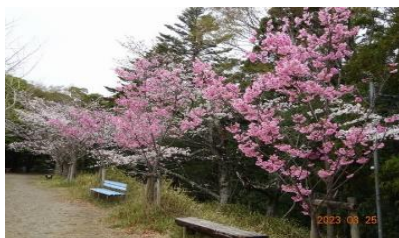
長岡公園と八条が池中之島の陽光桜