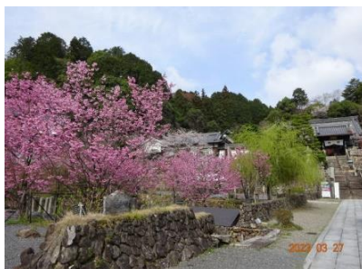
柳谷観音周辺の陽光桜