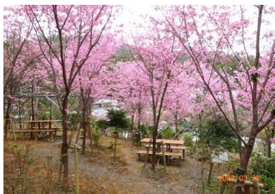
陽光桜苑の陽光桜 30本以上咲いています

*4月の中頃には陽光桜苑のドウダンツツジに可愛い白い花が咲き出します。苑内には300株のドウダンツツジを植樹しています。