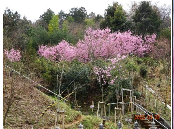
柳谷門前駐車場から眺める第1陽光桜苑。こ桜の下にベンチがあり小鳥の声を聴き乍らお花見を

陽光桜は3/20～3/28が満開でした 年々早くなる開花時期 来年のお花見ハイキングは3/25頃に変更が必要？