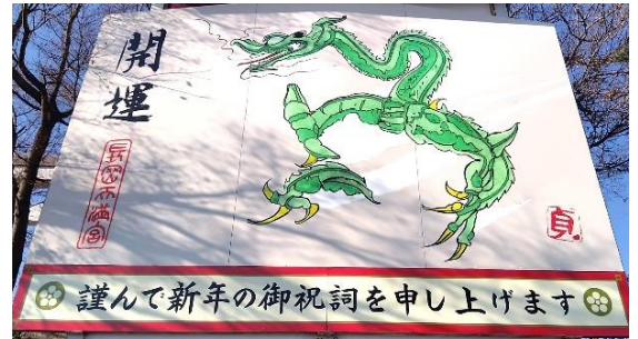
長岡天満宮の 大絵馬

(FACEBOOK) https://facebook.com/京おとくに街おこしネットワーク